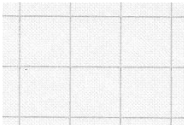
Quadretti di 1-2 a : (1 cm di lato)