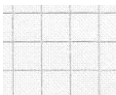
Quadretti di 3 a : (0,5 cm di lato)